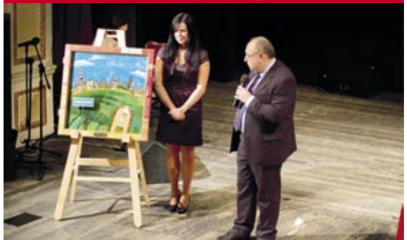
Wylicytowaliśmy kilka prac naszych podopiecznych.