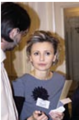
W oczekiwaniu na gości.