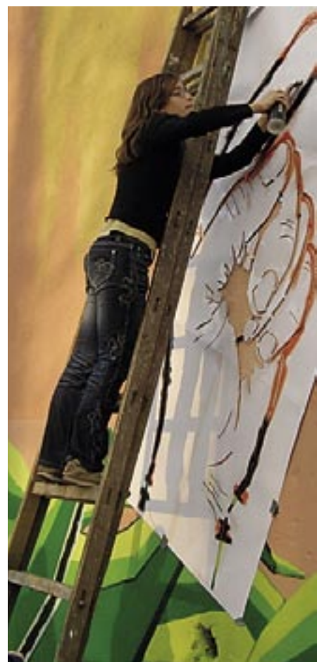
Warsztaty w Gimnazjum im. ks. Twardowskiego w Bielsku-Białej.