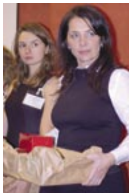
A Oni kupili cegiełki.