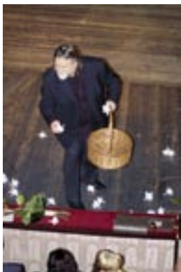
Obsypaliśmy Ich kwiatami.