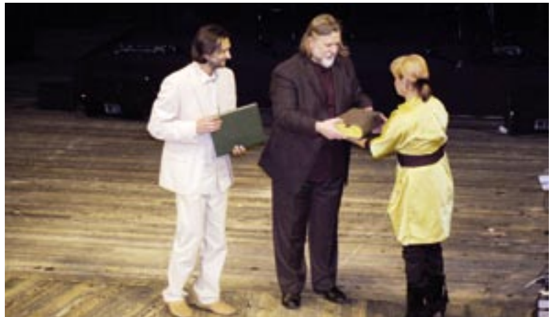
Wręczyliśmy Złote Cegły.