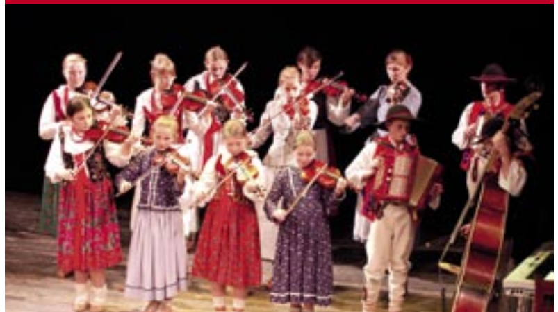
Koncert uświetniły występy zespołu „Fundacji Braci Golec”